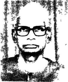
मितलात्ताचार्य बशाभर व्याकरणाचार्य